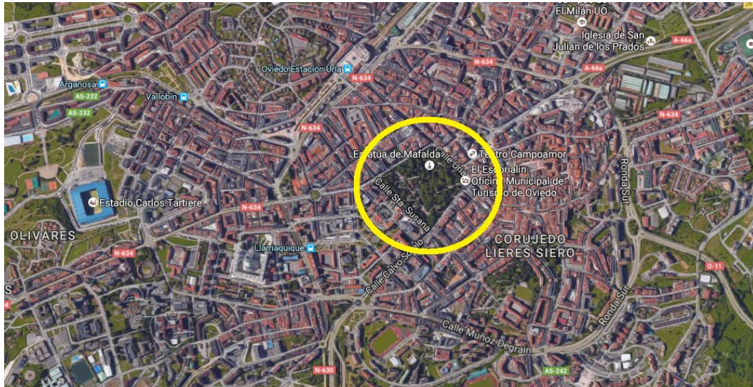
En Amarillo Zona del Evento